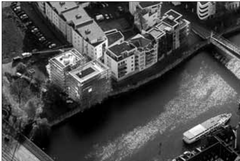
Umstritten: Das Grundstück an der Fulda (links) ist inzwischen bebaut. In dem Doppelgebäude entstehen Eigentumswohnungen. Unser Foto entstand bei einem Rundflug mit der Kasseler Flugschule Uwe Knabe.

Auslöser des Strafverfahrens gegen sie war ein Zivilstreit zwischen der Projektentwicklungsgesellschaft (PEG) der Stadt und einem Bauträger. Die Stadt hatte ihm die Baugenehmigung für ein Mehrfamilienhaus an der Fulda mit der Begründung untersagt, die vorgesehene Pfahlgründung gefährde das Bodendenkmal, das Aufschluss über die erste Stadtgründung und die im Zweiten Weltkrieg zer-